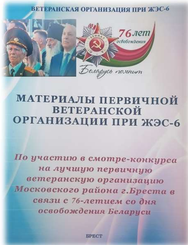
Материалы первичной ветеранской организации при ЖЭС-6

Мы познакомились с 2 фотоальбомами первичной ветеранской организации, где собраны фотографии встреч ветеранов с учащимися, молодежью и общественностью города.